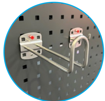
Possibilité de rangement sur la paroi latérale