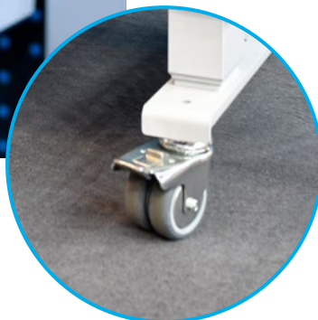
Mobile grâce à des roulettes pivotantes