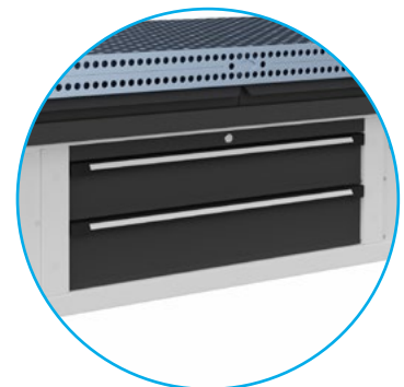
Schubladen für Werkzeuge